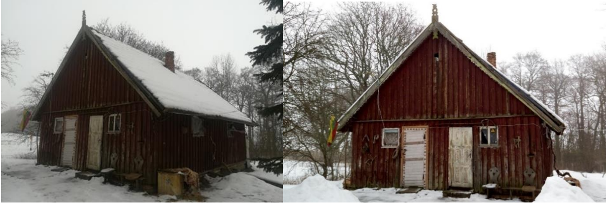
3 pav. Alksnynės viensėdžio sandėlio pastatas

Gyvenamojo namo laiptai, kurie veda į pastato vidų yra apgriuvę ir nėra saugūs, pastato raudonos plytos, kuriomis jis dengtas, vietose nuskilusios, o kai kur jų iš viso nėra. Bendras gyvenamoji namo vaizdas iš kiemo pusės, sudaro neigiamą įspūdį, kadangi pastato būklė rodo, jog jis yra senas ir nepakankamai prižiūrimas. Tačiau gyvenamojo namo vaizdas nuo gatvės pusės yra ženkliai geresnis - nėra matoma didelių pastato trūkumų, priešingai nei kiemo pusėje. Tačiau kitų dviejų Alksnynės viensėdžio pastatų - sandėlio pastato ( žr. 3 paveikslą ) ir ūkio pastato ( žr. 4 paveikslą ) būklės atrodo ženkliai prastesnė lyginant su gyvenamuoju namu.