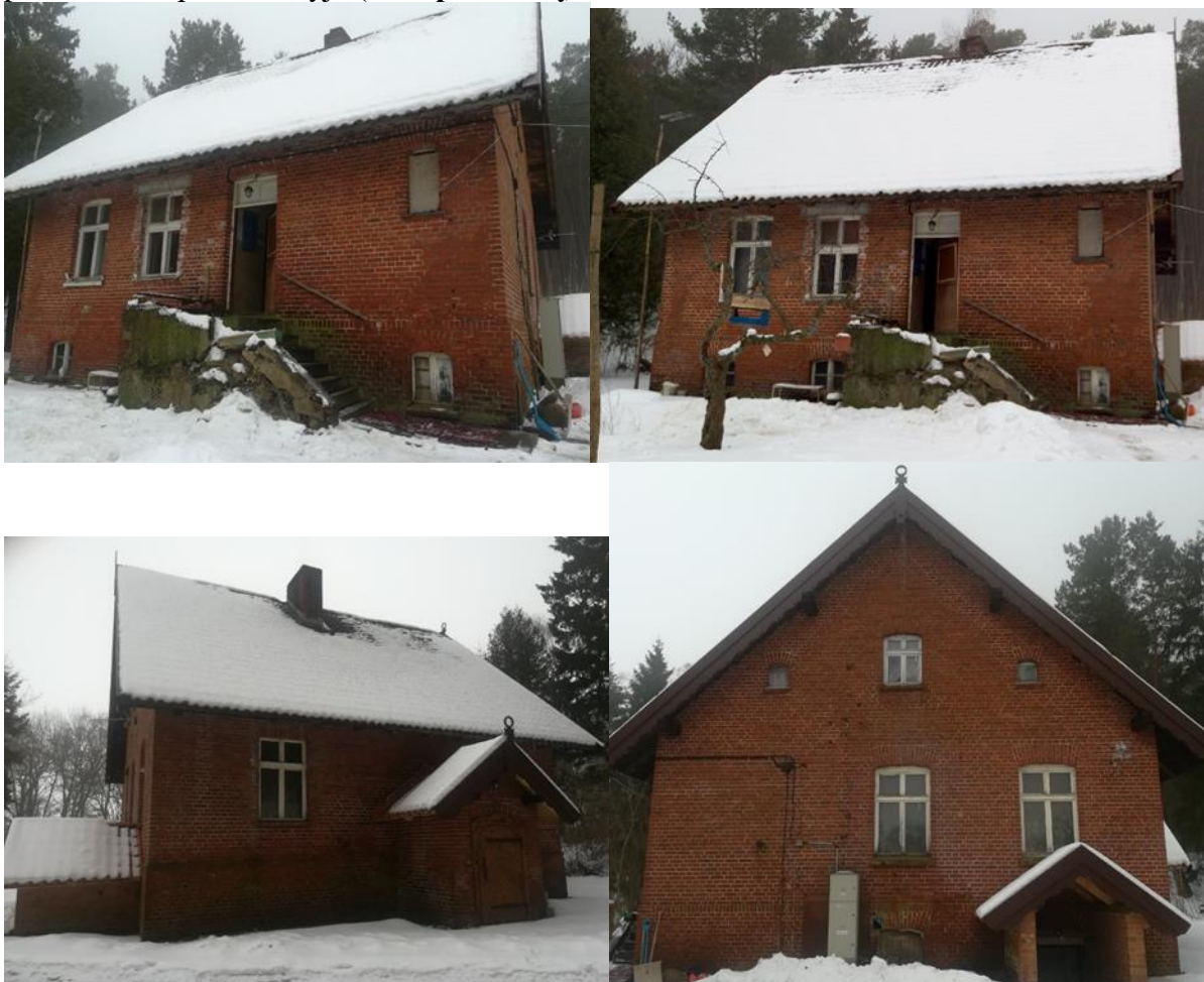
2 pav. Alksnynės viensėdžio gyvenamasis namas

Alksnynės viensėdžio atvejo analizė. Alksnynės viensėdis – tai gyvenvietė kurią sudaro viena sodyba (žr. 1 paveikslą). Žinoma šio objekto atsiradimo data yra fiksuojama 1795 metai (kultūros vertybių registras). Remiantis Kuršių nerijos nacionalinio parko direkcijos direktorės suteikta informacija, šiuo metu Alksnynės viensėdyje gyvena dvi šeimos, iš viso trys pagyvenusio amžiaus žmonės. Tai žmonės, kurie anksčiau dirbo miško ūkyje, nacionalinio parko direkcijoje. Viena šeima gyvena Alksnynės viensėdyje nuo 1973 metų, kita įsikėlė šiek tiek anksčiau nei pirmoji, tad šeimos objekte gyvena jau ilgą laiką. Alksnynės viensėdžio pirminė paskirtis buvo atlikti pašto stoties vaidmenį, vėliau objektas tapo kopų prižiūrėtojo namu, o paskui girininko sodyba, kuri buvo pavadinta Alksnyno vardu (Bučas J. 2001). Siekiant išsiaiškinti dabartinę Alksnynės viensėdžio būklę, pastatų stovį, buvo atliekama objekto foto fiksacija. Alksnynės viensėdį sudaro trys statiniai: 1. gyvenamasis namas, 2. ūkio pastatas, 3. sandėlio pastatas. Atliekant objekto foto fiksaciją, buvo pastebėta, kad iš objekto statinių, geriausią būklę išlaikė gyvenamasis namas, kurio nuotrauka pateikiama 2 paveikslėlyje (žr. 2 paveikslą).