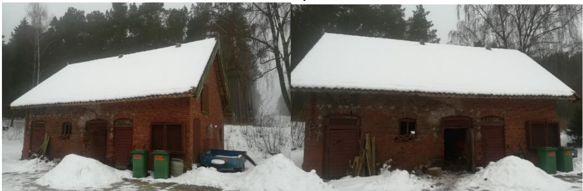
4 pav. Alksnynės viensėdžio ūkio pastatas