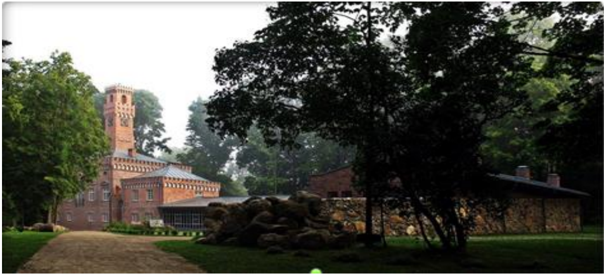
1. pav. Plungės rajono savivaldybės viešoji biblioteka

2008 m. birželio 26 d. Plungės rajono savivaldybės taryba priėmė sprendimą „Dėl pritarimo investicijų projektui „Plungės rajono savivaldybės viešosios bibliotekos pastato rekonstrukcija ir Oginskių dvaro ansamblio laikrodinės-oranžerijos restauravimas ir pritaikymas bibliotekos reikmėms“. 2009 m. iš Valstybės investicijų programos (VIP) gautas finansavimas ir pradėti pirmieji laikrodinės restauravimo darbai. 2012 metais baigta laikrodinės-oranžerijos renovacija ir spalio 13d. biblioteka persikėlė į naujas patalpas t.y. kunigaikščio M.Oginskio dvaro ansambliui priklausančią laikrodinę-oranžeriją, kuri buvo pastatyta 1846 metais (1 pav).