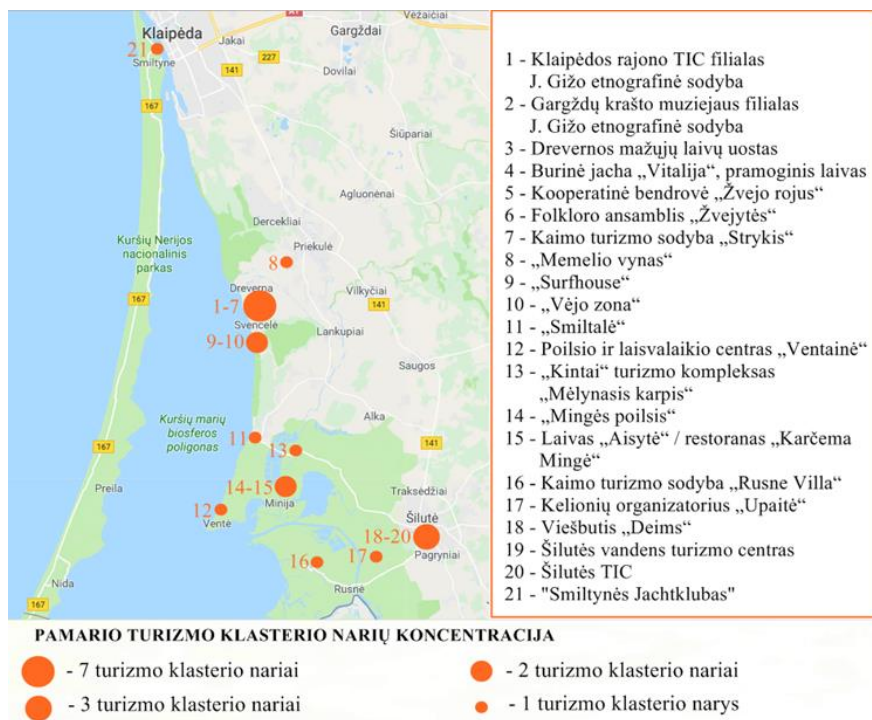
2 pav. Pamario turizmo klasterio narių išsidėstymas