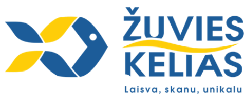
3 pav. Pamario turizmo klasterio logotipas

Šiuo metu Pamario turizmo klasteris siūlo 24 skirtingus turizmo paslaugų paketus , kurie pagal veiklos turinį yra skirstomi į penkias grupes: pramoginiai plaukimai, degustacijos, ekskursijos ir edukacijos, apgyvendinimas ir konferencijos bei aktyvios pramogos . Kiekvienoje turizmo paslaugų paketų grupėje dažniausiai yra pateikiama po penkis skirtingus pasiūlymus turistams. Kaip pagrindinę Pamario turizmo klasterio siūloma paslauga pateikiamas kulinarinis kruizas „Žuvies kelias“ , jau tapęs turizmo klasterio šūkiu, prisistatymo modeliu ir logotipu (žr. 3 pav.).